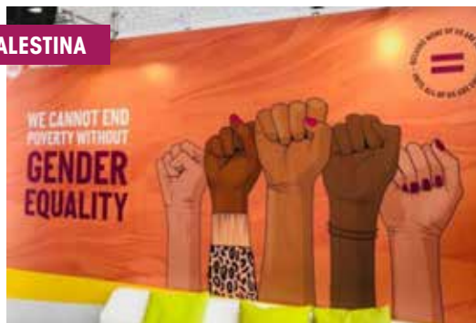
Progetto della cooperazione italiana in Palestina. in occasione di un meeting sulla campagna dei 16 giorni