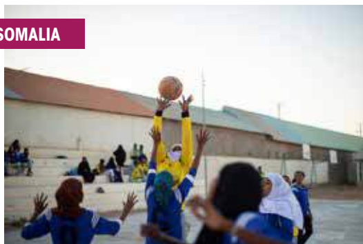
Progetto della Cooperazione Italiana in Somalia.