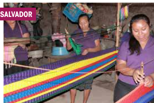
Progetto della Cooperazione Italiana in El Salvador.