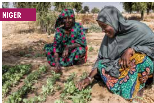
Progetto della Cooperazione italiana in Niger.