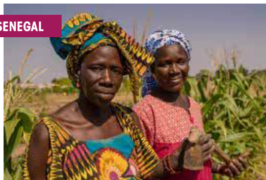
Progetto della Cooperazione Italiana in Senegal.