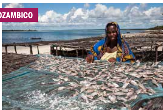
La pesca è un'attività fondamentale per l'autosussistenza e per il commercio nelle aree costiere del Paese. Foto di Luigi Carta, 2017.

Il presente documento è stato redatto dall'Agenzia Italiana per la Cooperazione allo Sviluppo con il concorso della Direzione Generale per la Cooperazione allo Sviluppo (DGCS) del Ministero degli Affari Esteri e della Cooperazione Internazionale (MAECI). La redazione del documento ha previsto un processo di consultazione, coordinato dalla DGCS del MAECI, con le Organizzazioni della Società Civile e con il gruppo di lavoro "Strategie e linee di indirizzo della cooperazione italiana allo sviluppo" del Consiglio Nazionale per la Cooperazione allo Sviluppo (CNCS), che hanno contribuito all'elaborazione del testo attraverso successive revisioni. Si ringraziano tutte le parti intervenute nel processo.